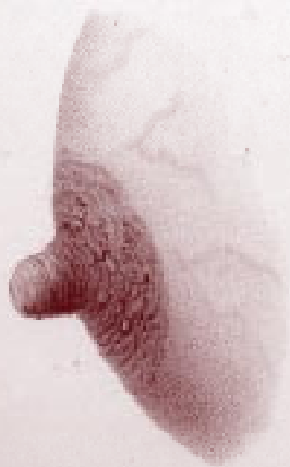
Fig. 2. Figura de una curvatura que es un.