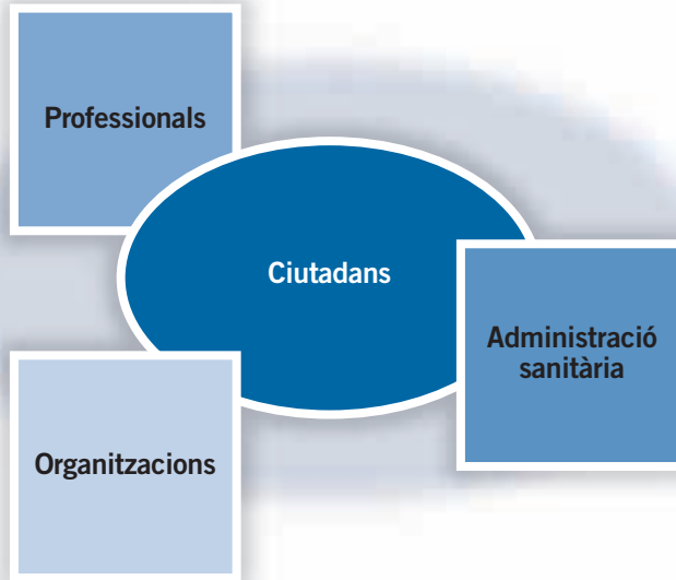
Gràfic 1. El desenvolupament dels recursos humans orientat a les necessitats dels ciutadans

A Catalunya, la situació dels professionals de l'àmbit del sistema sanitari és similar a la d'altres països industrialitzats del nostre entorn. Els serveis assistencials estan ben desenvolupats i els recursos, en general, són suficients i tenen una gran capacitat; hi ha, però, problemes d'adequació quantitativa i qualitativa a les noves necessitats. Podem dir, doncs, que la funció de desenvolupament i gestió dels recursos humans és crítica, i que cal millorar la gestió de professionals en tots els seus vessants: desenvolupament professional, oportunitats formatives i reconeixement intern i social.